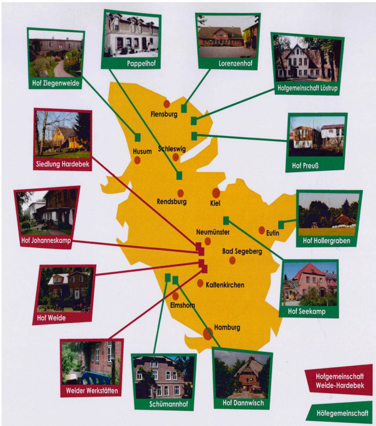
Kuva 3: Weide-Hardebekin tilayhteisöt (punainen) ja tilojen yhteisö (vihreä) Pohjois-Saksan osavaltiossa Schleswig-Holstein.

eurooppalaisen yhteistyön kautta kasvava määrä aloitteita, jotka tuntevat luonnon salutogeneettisen vaikutuksen molempiin: erityisryhmiin ja hoitaviin ihmisiin.